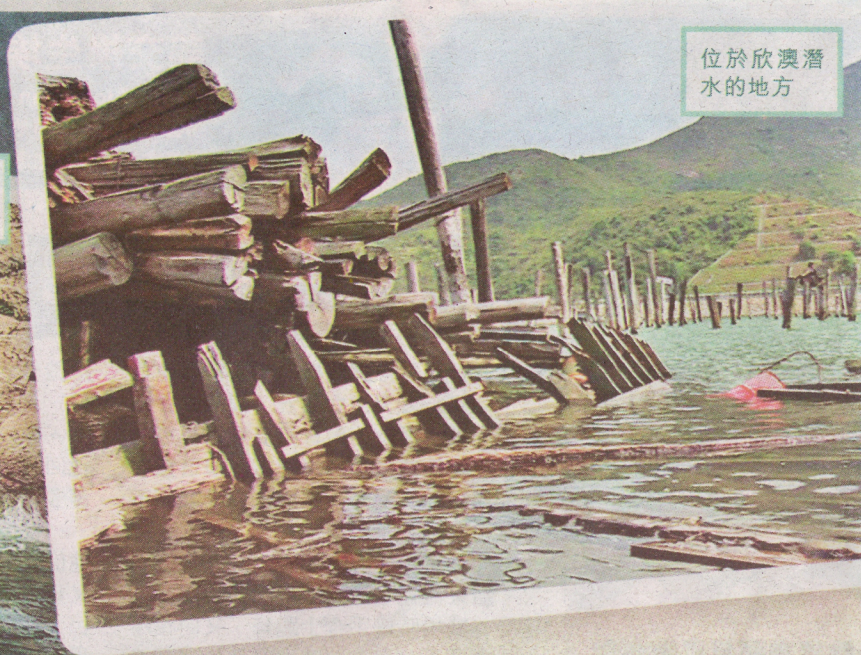
位於欣澳潛 水的地方

。海盜通常給人神秘而浪漫的色彩，因此他們經常成為電影和 一群愛好水下考古的潛水人士，既探訪了位於春坎角及長洲的 從而發掘出張保仔傳奇的一生。 撰文：劉健倫